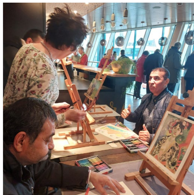
Festival Zin, 19 februari 2023