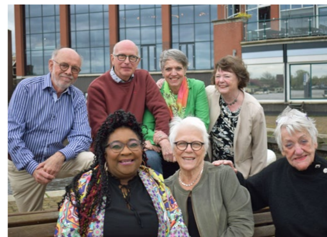
De leden van de Programmeringscommissie Theater op de Dinsdagmiddag

In 2023 bezochten 1.793 mensen 11 voorstellingen. Een groep enthousiaste vrijwilligers in de leeftijd van 60 jaar of ouder, stellen samen met onze programmeur een divers en passend programma samen voor degene die bij voorkeur overdag uit gaat. Ook veel alleengaanden weten elkaar te