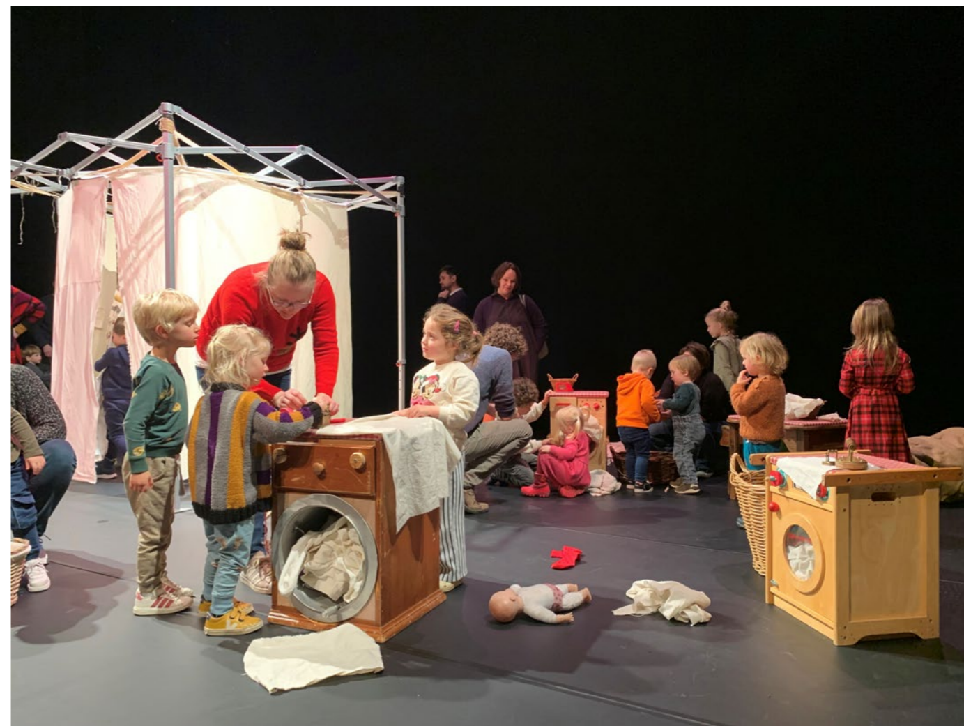
Kindervoorstelling 'Was', waarin de kinderen mee mochten doen op het podium.

Per 1 oktober 2023 is het Zaantheater aangesloten bij de Podiumpas. Een nieuwe pas, geïnspireerd op de kortingspassen zoals in de bioscoopbranche gebruikelijk zijn. Doel van de pas is om theaterbezoek laagdrempeliger te maken. Voor € 35,- per maand kun je met deze pas onbeperkt naar voorstellingen en concerten bij aangesloten podia verspreid door heel Nederland, te reserveren vanaf 30 dagen voor aanvang van de voorstelling. Een uitgebreide pilot heeft uitgewezen dat bezoekers met een podiumpas avontuurlijker keuzes maken, vaker het theater bezoeken en dat het meer bezoekers en omzet oplevert. Wat de impact voor het Zaantheater is, is nog een beetje vroeg om concluderen. De eerste indruk is positief.