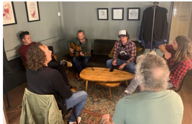
The Dutch Eagles aan het inzingen in hun kleedkamer

15 APR / De Kift – Feest van het hondsvot (Kleine zaal) is een 'Flux op locatie'-avond: hiervoor verzorgt De Flux de bespeling, levert vrijwilligers, doet de kaartverkoop en doen De Flux en het Zaantheater samen de promotie.