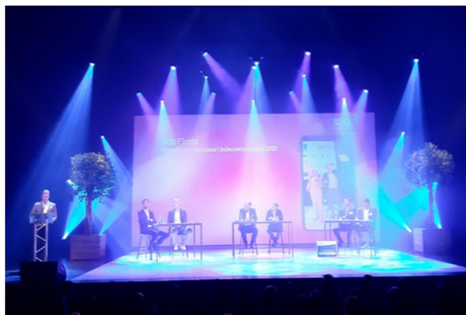
Zaanse Ondernemersdag 2023