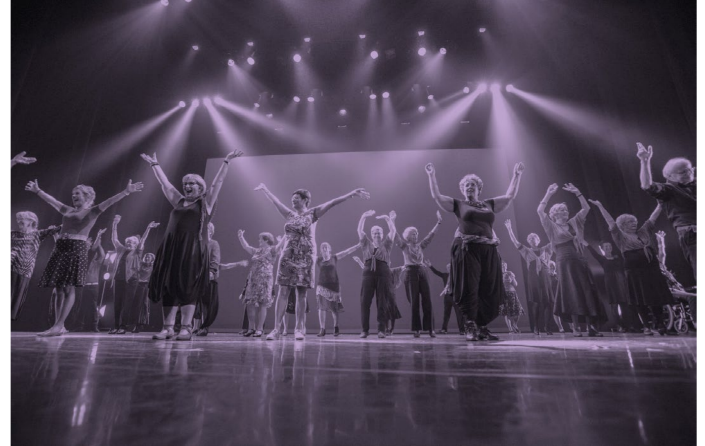
Gouden Dans, Zaantheater

Bezoekers die via Theater voor iedereen naar het Zaantheater komen zijn er vaak voor het eerst en het bijwonen van een voorstelling wordt ervaren als een hoogtepunt. Door financiële omstandigheden