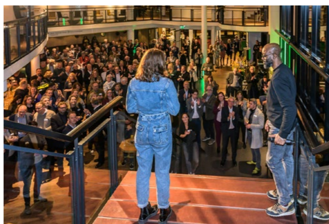
Nieuwjaarsreceptie Gemeente Zaanstad 2023