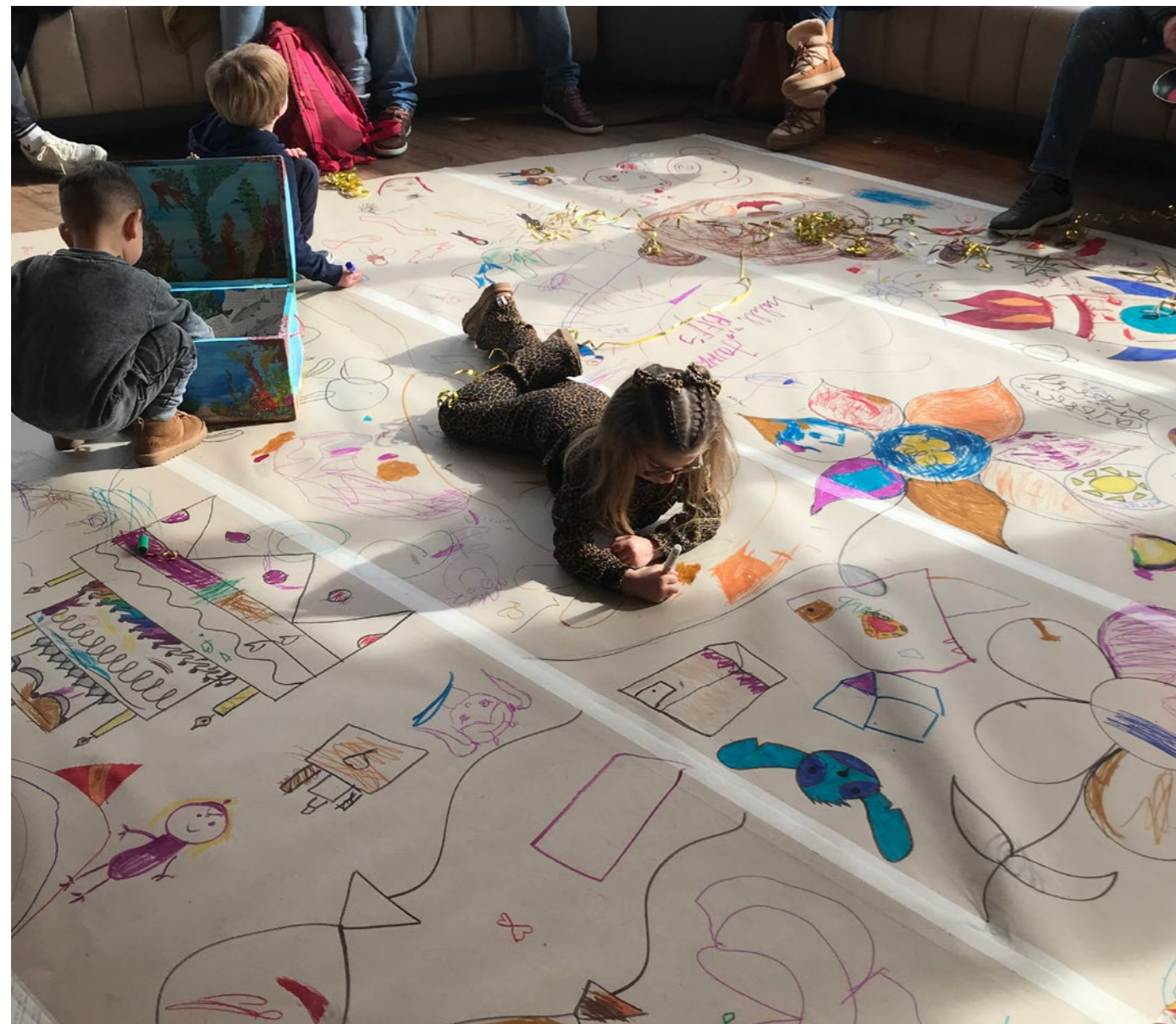
Het groot avonturenfeest

Fair Pay is een gezamenlijke verantwoordelijkheid voor de gehele branche; van podium, artiest, manager, publiek en overheden. Iedere schakel is nodig om een veelzijdig en avontuurlijk cultureel aanbod te hebben en te behouden.